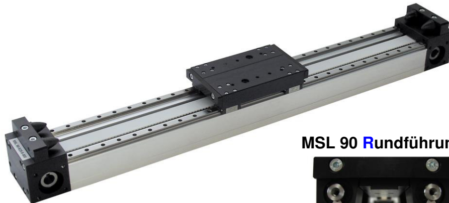
MSL 90 R undführung