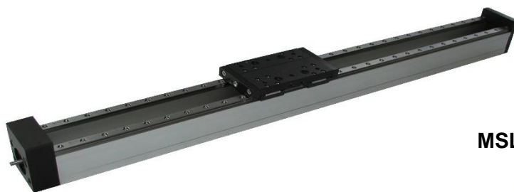
MSL 65 Schienenführung