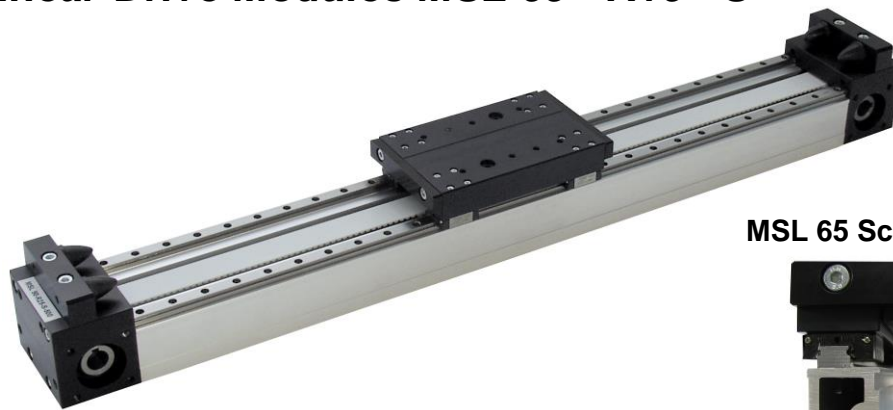
MSL 65 Schienenführung